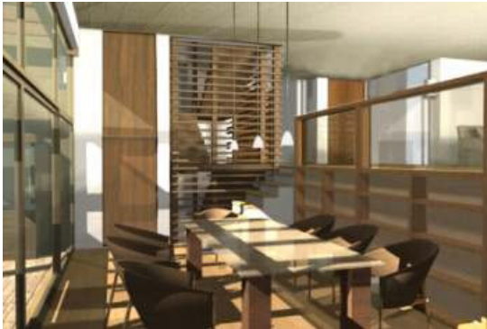
Dinning room / Living room